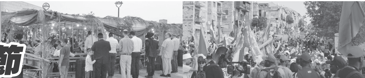
▲住棚節時的耶路撒冷老城