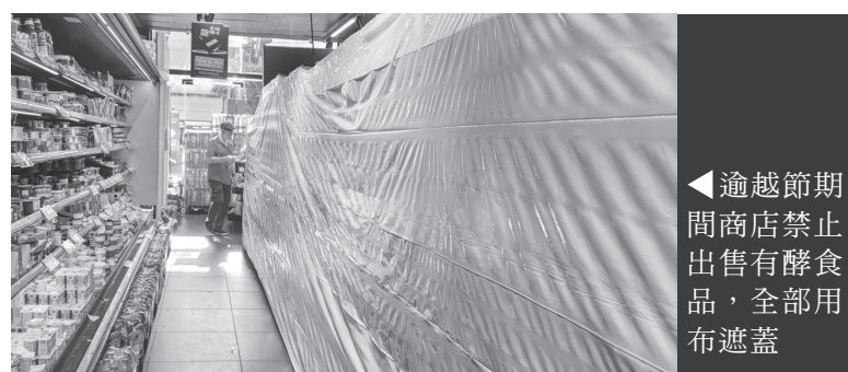
◀逾越節期間商店禁止出售有酵食品，全部用布遮蓋

守，亦為「誌」，記在心裏。每個節期都與以色列整個民族的歷史緊密相連。節期是歡喜快樂的場合，當百姓聚集和宴飲的時候，更重要的核心內容，是要傳講和記念上帝在祂的子民身上所彰顯的作為——逾越節是回顧整個民族在摩西帶領下擺脫埃及人的奴役、獲得解放（申十六1）；七七節是紀念神賜給百姓流奶與蜜的豐富之地（申十六15），也被稱作「得到妥拉的日子」，感恩上帝在西奈山賜下律法（出十九1-2）；住棚節是追思以色列人出埃及後在曠野中漂流四十年期間所住的棚屋，紀念上帝的供應和庇護（利廿三42-43；申八2-5）。藉著每一年的每一個節期，猶太人一遍又一遍地講述本民族的歷史、傳統、習俗，講述上帝的作為。一旦離開這些「節期」所表明的神的心意，「耶和華的節期」就成了人的宗教活動或娛樂慶