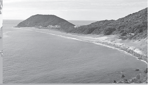
▲ Atsumi Peninsula (渥美半島) - Cape Irago

In 1988, I left Oslo for Tokyo on an early morning departure flight on a cold winter day. It was not a direct flight but had a relatively short overlay in Hong Kong. My destination was a small agricultural town in Aichi Prefecture (愛知縣), Central Japan. The last leg of the journey was by train from Tokyo to Aichi. Our plane approached Haneda Airport, Tokyo, around 8:00 pm local time. The vivid impression of a foreigner newly arrived in the megacity of Tokyo was indelible and resonates to this day. As a young man raised in Hong Kong and educated in North America, I bragged that I had seen aerial nightlights of large cities.